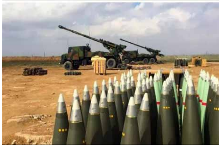
الشركات الفرنسية الثلاث، في الأول من يونيو 2022، بتهمة التواطؤ في جرائم حرب في اليمن. وفي تحقيق آخر، سابق، لموقع

نشر موقع "أوريان 21" الفرنسي، مؤخرًا، تحقيقًا صحفيًا، أكد فيه تورط شركات فرنسية بجرائم حرب في اليمن. وأكد تحقيق الموقع، أن ثلاث شركات فرنسية كبرى ومنتجها متورطون في نزاع أسفر عن مقتل أكثر من 13 ألف مدني خلال سبع سنوات في اليمن. وذكر التحقيق أسماء هذه الشركات وهي "مجموعة تاليس" التي تزود الطائرات المقاتلة وتسلم الذخيرة، وشركة تصنيع الصواريخ الفرنسية البريطانية (MBDA)، بالإضافة إلى شركة "داسو" للطيران، موضحة بأن الأخيرة تقوم بصيانة طائرات ميراج 2000، مؤكدة كسبها عقودًا قياسية مع الإمارات. وبحسب التحقيق، فإن أربع منظمات غير حكومية رفعت دعوة ضد هذه