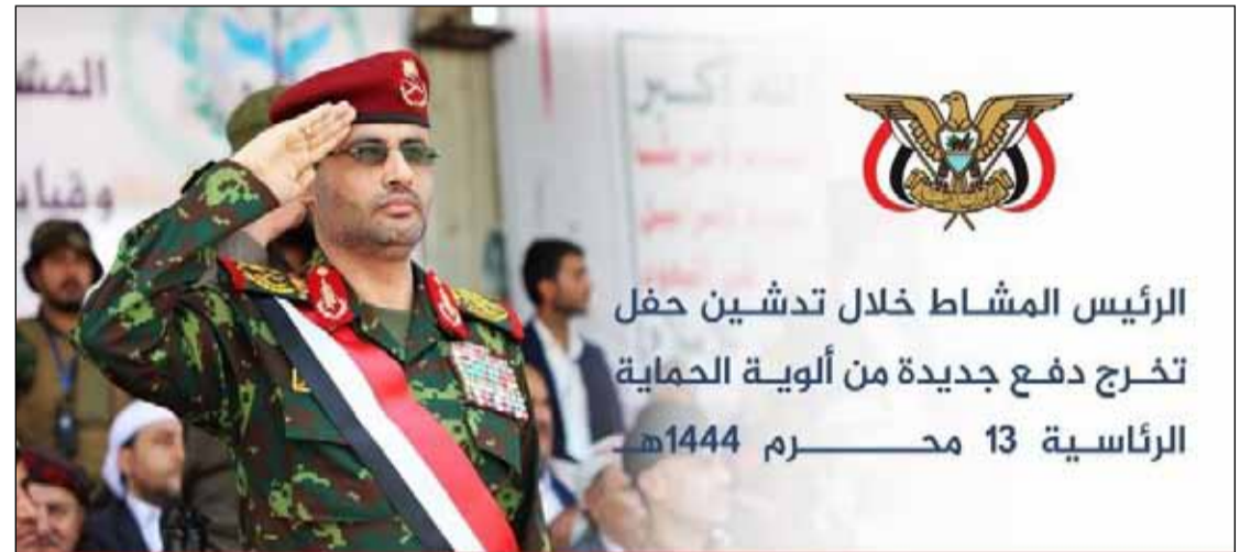
الرئيس المشاط خلال تدشين حفل تخرج دفع جديدة من ألوية الحماية الرئاسية 13 محرم 1444هـ

■ نحذر قوى العدوان من استمرار الامتناع عن سداد الرواتب من ثروة الشعب المنهوبة والمسروقة ■ نحن في موقف الدفاع عن بلدنا ولا نشكل خطراً إلا من يتآمر